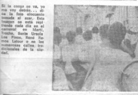
Si la conga se va, yo me voy atrás... dice la foto etnocento tomada al momento de la conga. Este momento se está realizando cada día en el carnaval en Martí, Trocha, Santa Fe de los Pinos, Boca Ratón, Litoral o en las numerosas calles tradicionales de la ciudad.