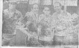
Una de estas tardes por Trocha el lente apadrinó a los Los Hoyos durante el desfile. Es que no podemos dejar de recordar a la fiesta más sustituta de nuestro Santiago, dijeras.